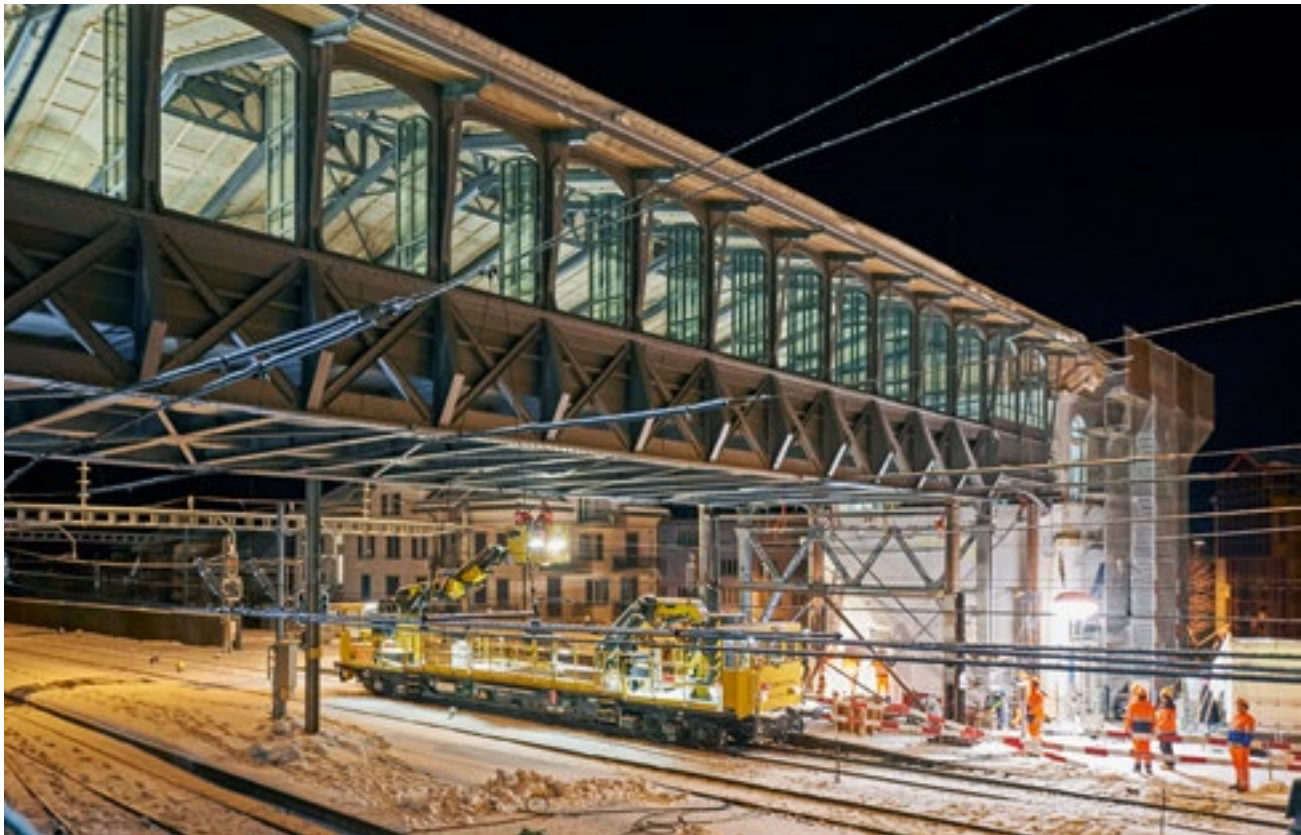
Der Hochperron der Arth-Rigi-Bahn in Goldau , einem Reitergebäude über den Gleisen der SBB-Linie Luzern–Lugano bzw. der Gotthardbahn. Seit Februar 2015 steht er angehoben, aber in der originalen Stahlkonstruktion um 72 cm erhöht auf neuen Auflagern.

D er Kopfbahnhof der Arth-Rigi-Bahn in Goldau ist bezüglich Situation und Stahlbauweise schweizweit einmalig. Er wurde 1897 gebaut, nachdem der Keilbahnhof Arth-Goldau ein Aufnahmegebäude erhalten hatte und die Gleise der Rigibahnen neu geführt werden mussten. Rechtwinklig als Reitergebäude überspannt er seither die SBB-Gleise nach Luzern am westlichen Ende des Bahnhofs mit einer markanten und für seine Zeit fort-