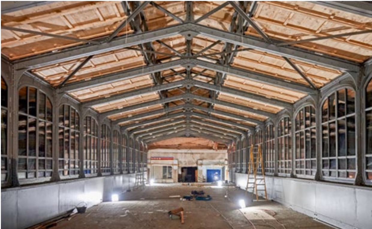
Das Tragwerk des Satteldachs mit dem im First aufgesetzten Oberlicht wurde nachträglich auf den Obergurt der Fachwerkträger gestellt. Es ist eine filigrane Stahlkonstruktion aus Zweigelenkrahmen. Windverbände steifen die Dachebene aus.

den Bahnbauten der Gotthardlinie bilden das Reitergebäude des Hochperrons und das turmartige Stationsgebäude ein Ensemble von besonderem technikkund- und kulturgeschichtlichem Wert und von nationaler Bedeutung. Insbesondere das Tragwerk ist ein beeindruckendes