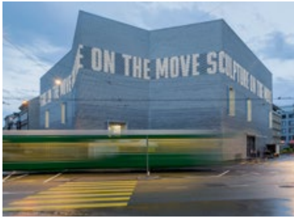
Eingelegte LED-Streifen in den Rillen der Friessteine beleuchten die Hohlkehlen der Backsteine.